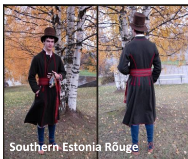
Southern Estonia Rõuge