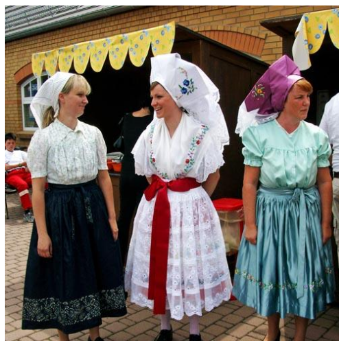
Traditsiooniline kostüüm - Sorbs, Cottbus