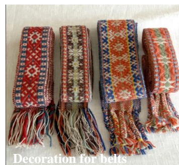
Decoration for belts