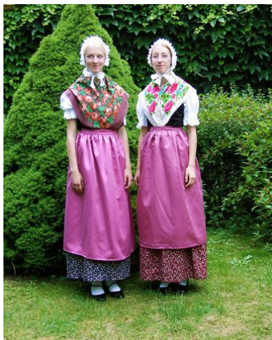
Traditsiooniline kostüüm Sorbsist Bautzen

Seitse küla "Kirchspiel Schleife" kuuluvad Schleiferi valdkonnas. Halb majanduslik olukord kajastuvad ka materjalide valikule. Põhilised materjalid on puuvillane ja linane riie. Umbes põlvikud sinine-roheline triibuline seelik ja plisseeritud vill kangast suurte siniste prindi põll on seatud oma vahel. Kork - mida toetab pappiga - punane muustriline kangas tüdrukule ja sinine või roheline-valge kangas naisele. 2002 aastal, 75 naist loendati kes pidevalt kasutab kostüüm.