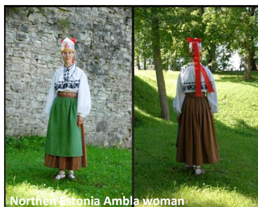
Northern Estonia Ambla woman

Eesti rahvusliku kaunistused olid peamiselt geomeetrisel ja kasutatakse tavaliselt nagu vöö ja kinnase mustrid, või nagu särk tikand.