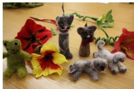
Fotod: Naomi e.V. ühenduse töötuba